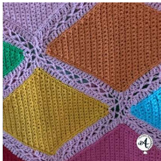
Een gehaakte spekjesdeken

Ik heb twee dagen lang niets anders gedaan.